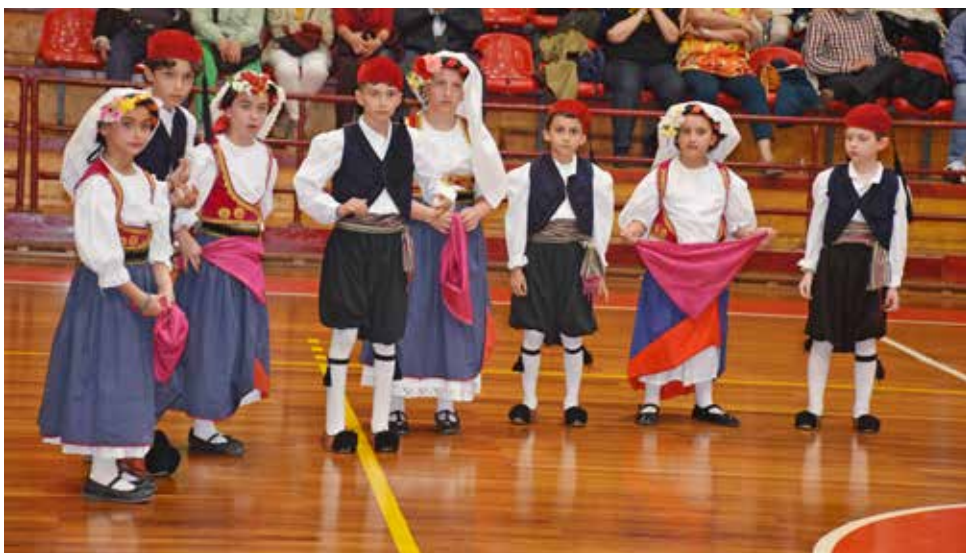
Το παιδικό τμήμα του Μικρασιατικού Συλλόγου Καισαριανής.

Οι χορευτές εντυπωσίασαν με τις παραδοσιακές τους φορεσιές και το μεράκι τους, ταξιδεύοντας τους παρευρισκόμενους στις μουσικοχορευτικές ρίζες της Λέσβου, της Βορείου Ηπείρου, της Μικράς Ασίας και άλλων περιοχών του Ελληνισμού. Η βραδιά έκλεισε αφήνοντας τις καλύτερες εντυπώσεις, ανανεώνοντας το ραντεβού για το επόμενο φεστιβάλ.