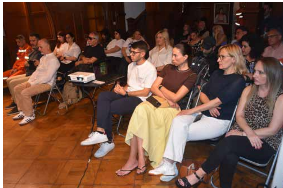
Πλήθος κόσμου εκ των οποίων πολλοί νέοι άνθρωποι, παρακολούθησαν την ημερίδα.