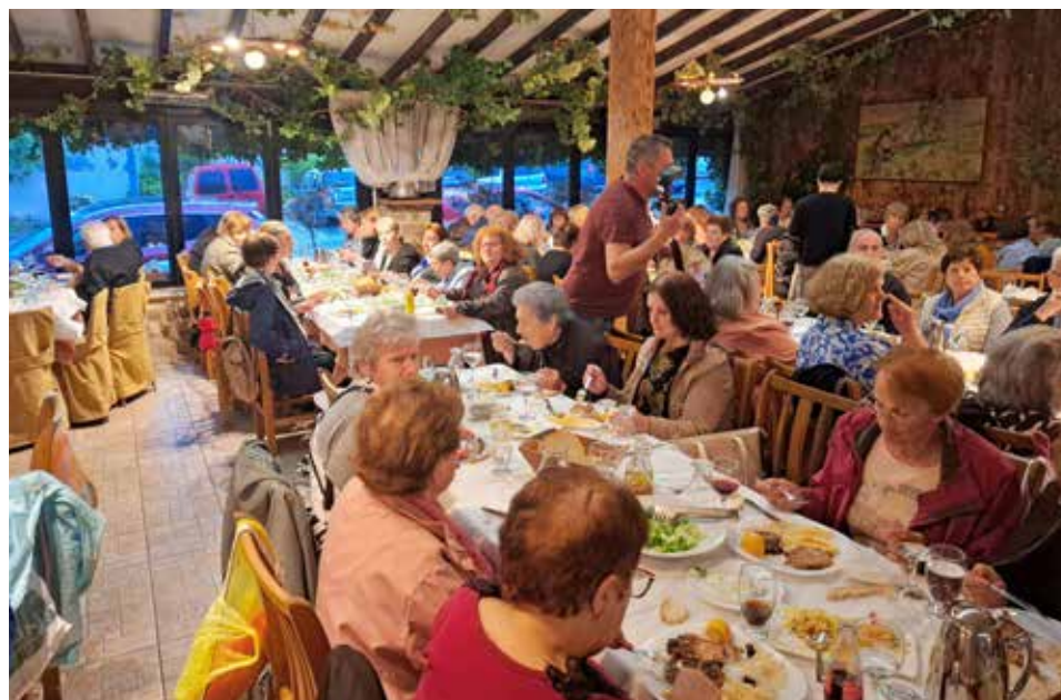
Στιγμιότυπο από το δείπνο σε κοσμική ταβέρνα της Καστοριάς.