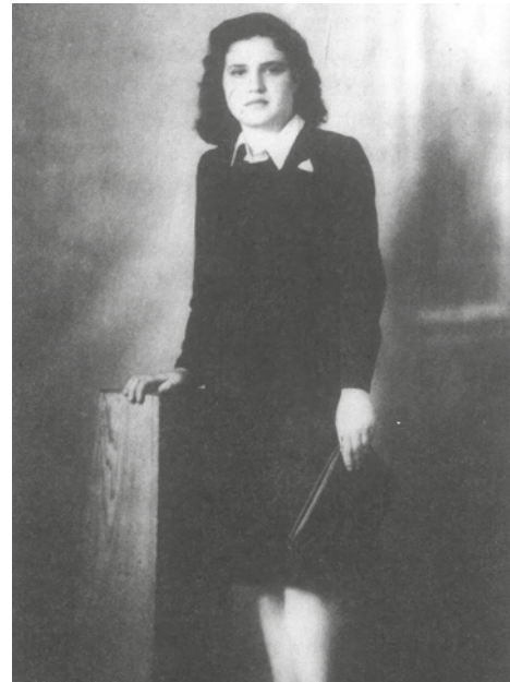
Πηγαίνοντας στη Χαλκίδα για να αντιμετωπίσει το Δικαστήριο (1949).

Εκδήλωση τιμής και μνήμης με αφορμή την επέτειο των 100 χρόνων από τη γέννηση της «Μάνας της Καισαριανής» Ευτυχίας Μουρίκη πραγματοποιήθηκε από τον Δήμο Καισαριανής το απόγευμα της Τρίτης, στη συμβολή των οδών Βρουύλων & Τζων Κέννεντυ. Η εκδήλωση ολοκληρώθηκε με τα αποκαλυπτήρια του νέου ονόματος της οδού Τζων Κέννεντυ σε οδό Ευτυχίας Μουρίκη, υλοποιώντας τη σχετική ομόφωνη απόφαση του Δημοτικού Συμβουλίου Καισαριανής. Η Ευτυχία Μουρίκη ξεκίνησε την αντιστασιακή της δράση μέσα από τις γραμμές της ΕΠΟΝ και εντάχθηκε στον ΕΛΑΣ, δρώντας στην Καισαριανή. Ήταν η πρώτη γυναίκα διοικήτρια λόχου. Τον Μάη του 1944 έγινε μέλος του ΚΚΕ, μετά την εκτέλεση των 200 που είδε και κατέγραψε σε μαρτυρία. Πήρε το προσωνύμιο της «Μάνας», παρά το νεαρό της ηλικίας της, καθώς μοίραζε το φαγητό στους αιχμαλώτους και έπειτα στους συναγωνιστές της. Τραυματίστηκε τον Δεκέμβρη του 1944,