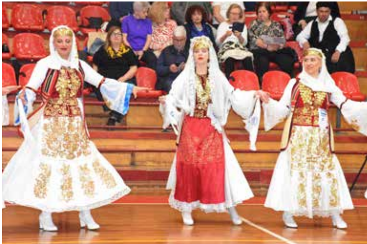
Ο Χορευτικός και Πολιτιστικός Σύλλογος Δερόπολης «Δερόπολη» είχε εντυπωσιακή παρουσία.