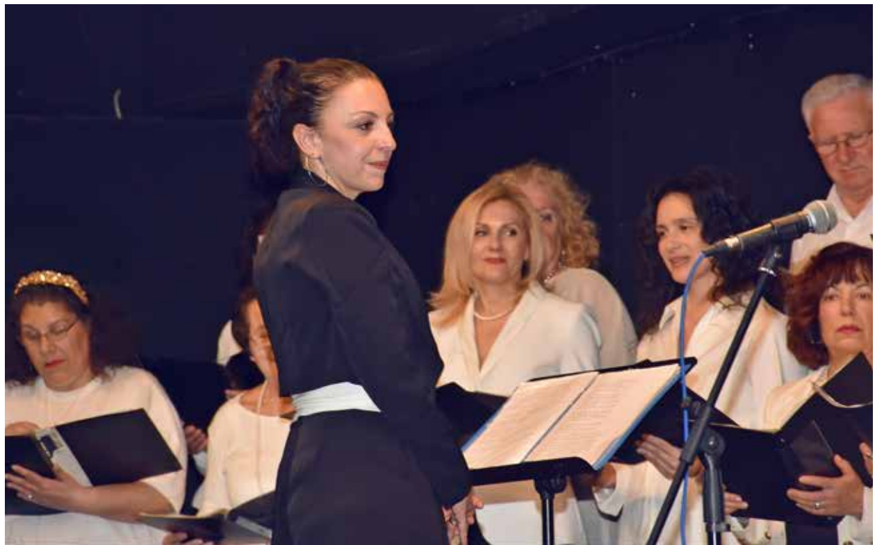
Στιγμιότυπο από το Χορωδιακό Φεστιβάλ Δήμου Καισαριανής.