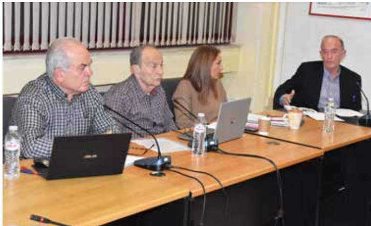
Εμφανής ήταν η συγκίνηση των στελεχών της δημοτικής αρχής μετά την αποκάλυψη των ιστορικών φωτογραφιών. Από αριστερά: Ο δήμαρχος Ηλίας Σταμέλος, ο πρόεδρος του Δ.Σ. Νικόδημος Κατσαρέλλης και ο πρώην δήμαρχος Σπύρος Τζόκας.