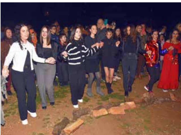
Η νεολαία πρωτοστατεί στον χορό.