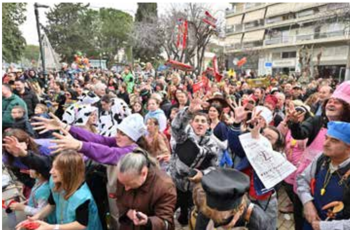
Παιδιά και νέοι αρπάζουν σοκολάτες στον αέρα.