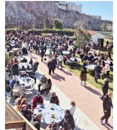
Βυρωνιώτες και Υμητιώτες απολαμβάνουν σαρακοσιανά εδέσματα στα θέατρα Βράχων.

Ο Δήμαρχος Βύρωνας ευχαρίστησε θερμά τους εθελοντές δασοφυροσβέστες, τους συλλόγους και τους εργαζόμενους του Δήμου για την πολύτιμη συμβολή τους στην ομαλή διεξαγωγή όλων των εκδηλώσεων.