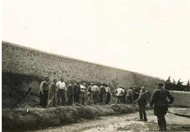
Αγωνιστές λίγα λεπτά πριν την εκτέλεση.

(Ελλάδα, 1943-1944). Αν και σε αυτήν αποτυπώνονται επίσης τοπία και σκηνές της κατοχικής καθημερινότητας, τα συγκεκριμένα καρέ της εκτέλεσης ήταν αυτά που καθήλωσαν την κοινή γνώμη, επιτρέποντας να ξεκινήσουν άμεσα οι πρώτες έρευνες ταυτοποίησης. Όπως αποκάλυψε το 902.gr, διασταυρώνοντας το αρχείο της ΚΕ του ΚΚΕ, στα ντοκουμέντα αναγνωρίστηκαν με ισχυρές ενδείξεις δύο αγωνιστές: ο Θρασύβουλος Καλα-