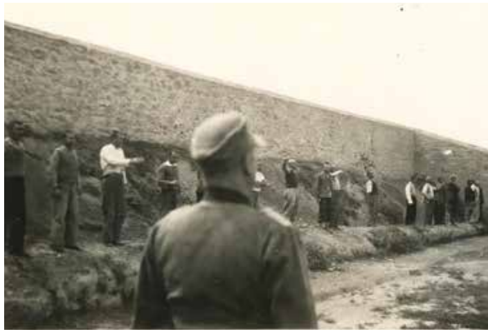
Άλλη μία συγκλονιστική φωτογραφία πριν την εκτέλεση. Αίσθηση προκαλεί ο άνδρας που υψώνει τη γροθιά του απέναντι στα πολυβόλα των Ναζί.