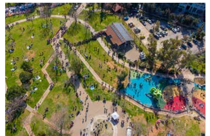
Ο κόσμος βγήκε μαζικά στο Πάρκο Γουδή για να γιορτάσει την Καθαρά Δευτέρα