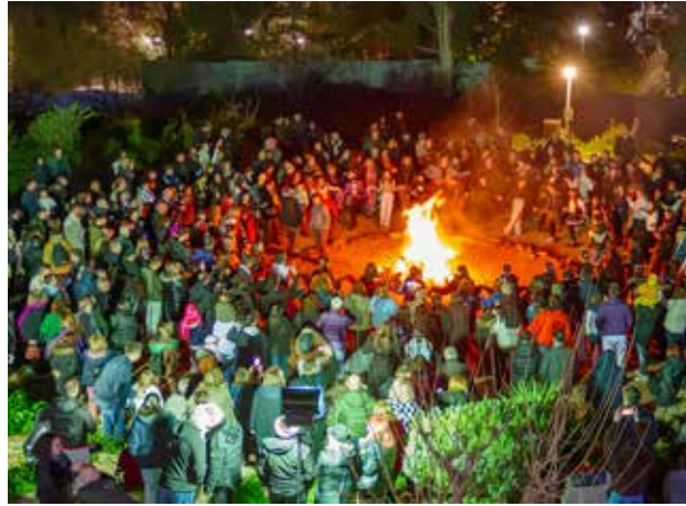
Έθιμο Τζάμαλα: Οι Ζωγραφιώτες χόρεψαν με κέφι γύρω από τη φωτιά.