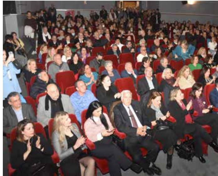
Η κατάμεστη αίθουσα της εκδήλωσης.