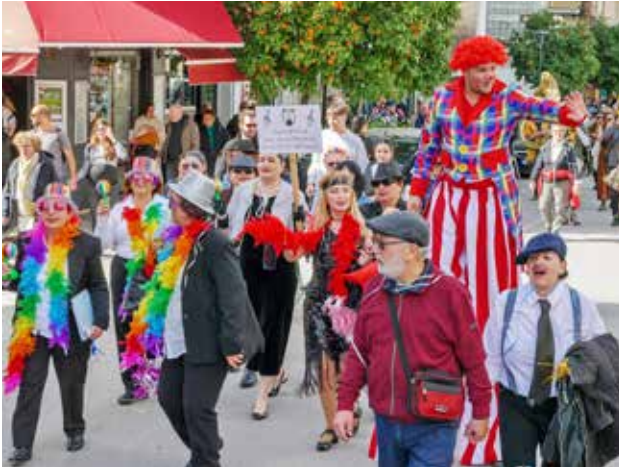
Στιγμιότυπο από την καρναβαλική παρέλαση.