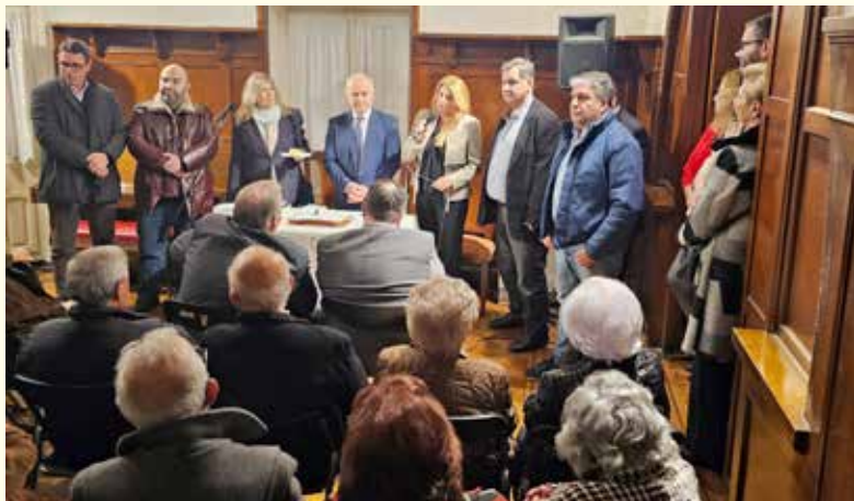
Η δημοτική ομάδα της «Συμμαχίας Δημιουργίας» δίνει το «παρών» στην εκδήλωση.