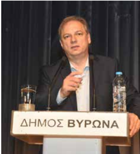
Ο δήμαρχος δεσμεύτηκε να παλέψει «για μια πόλη πιο ανθρώπινη, πιο δίκαιη, πιο αισιόδοξη».