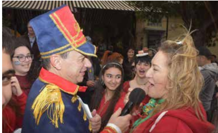
Ο δημοφιλής ηθοποιός Σταύρος Νικολαΐδης με καρναβαλιστές.

Με ένα πλούσιο πρόγραμμα δράσεων που συνδύασε τον σύγχρονο εορτασμό με την πα-