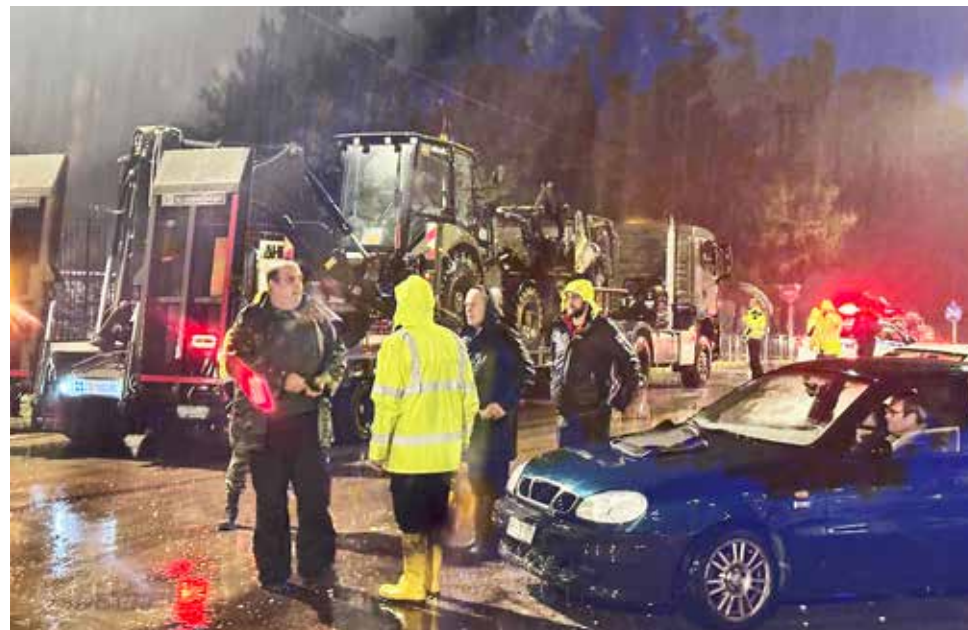
Η Πολιτική Προστασία του Δήμου υπό την καταρρακτώδη βροχή.

Σε πολιτικό επίπεδο, η καταστροφή προκάλεσε έντονη αντιπαράθεση. Η Δημοτική Αρχή, διαχωρίζοντας τη θέση της