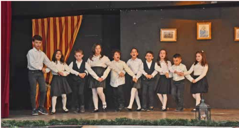
Το παιδικό χορευτικό τμήμα του Συλλόγου.