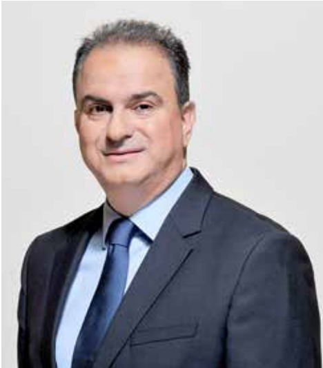
Άρθρο του Παναγιώτη Κόνσουλα, Οικονομολόγου-Πολιτικού Επιστήμονα