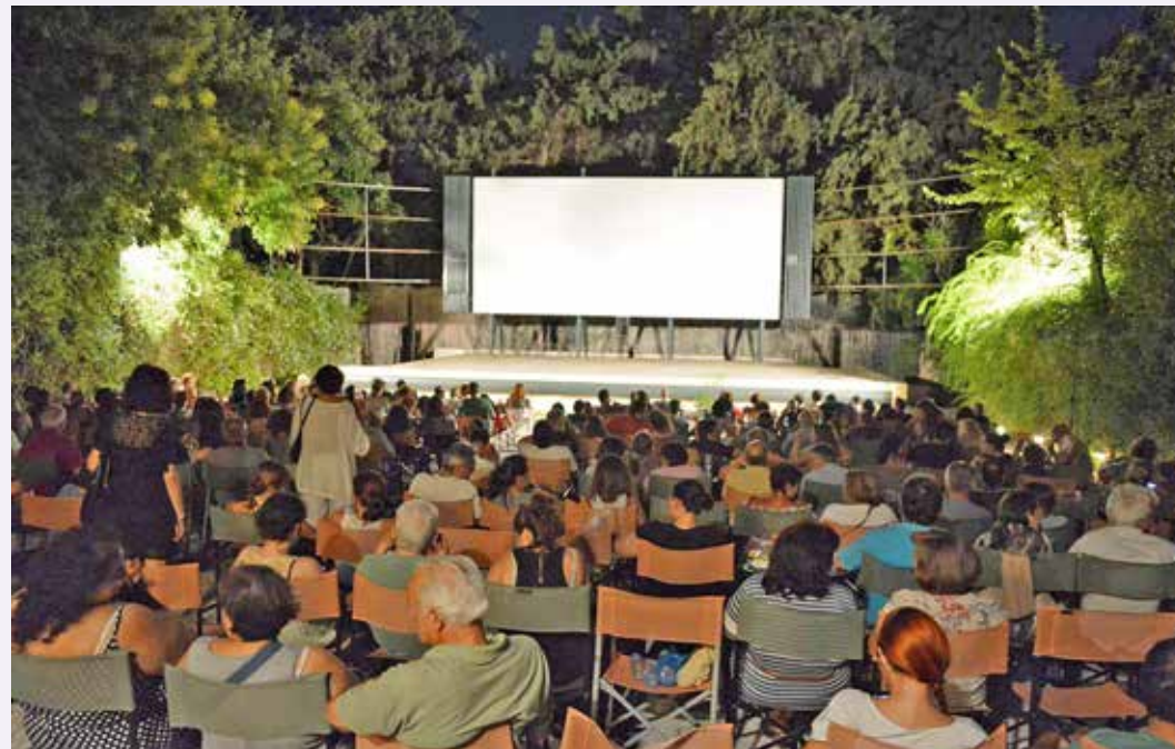
Ο θερινός δημοτικός κινηματογράφος «Αιολία».