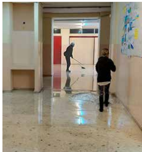
Νερά σε διαδρόμους των 5ου & 11ου Δημοτικών σχολείων.

Στο Δημοτικό Κοιμητήριο η εικόνα που διαμορφώθηκε παρουσίασε διαφοροποιήσεις ανά τμήμα. Στο κτίριο της Δημοτικής Επιχείρησης Ανάπτυξης Δήμου Βύρωνας (Δ.Ε.Α.Δ.Β.) και συγκεκριμένα στο κυλικείο, σημειώθηκε εισροή υδάτων. Για την αντιμε-