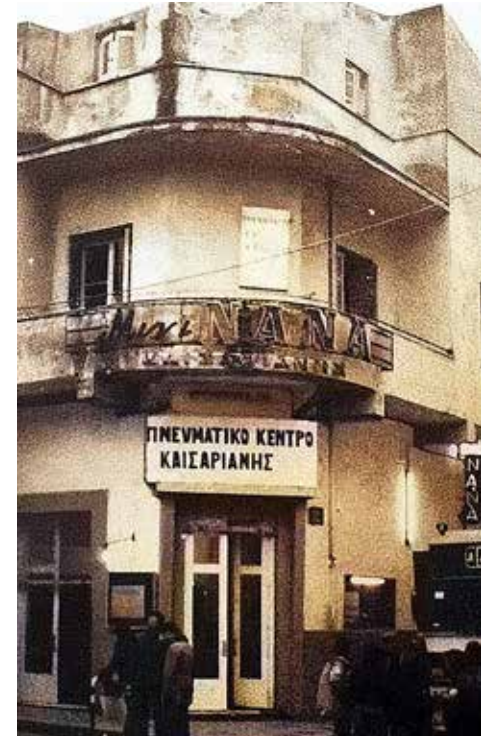
Ο κινηματογράφος NANA.