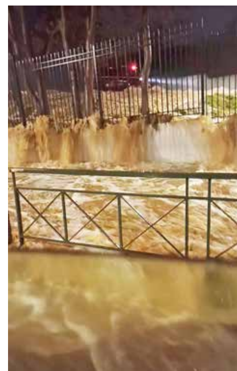
Το ρέμα πλημμύρισε με λασπόνερα το τμήμα της Εθνικής Αντιστάσεως πλησίον στο δημοτικό στάδιο.

κληρωμένου αντιπλημμυρικού έργου με ευθύνη Κράτους και Περιφέρειας, καθώς και η αποζημίωση στο 100% των ζημιών. Προς αυτή την κατεύθυνση, η Δημοτική Αρχή ανακοίνωσε τη σύνταξη υπομνήματος διεκδίκησης που αφορά εξοπλισμό, χρηματοδότηση και στελέχωση για σύγχρονες υποδομές. Παράλληλα, στο Κέντρο της Δασοπροστασίας, δόθηκε μάχη για τη διάσωση του υλικού. Με την άσκηση και επίπονη προσπάθεια των μελών της ομάδας, κατέστη τελικά εφικτό να διασωθούν όλες οι στολές και τα Μέσα Ατομικής Προστασίας που βρίσκονταν στην πλημμυρισμένη αποθήκη. Τα υλικά πλύθηκαν και μεταφέρθηκαν με ασφάλεια σε έτερο αποθηκευτικό χώρο του Δήμου.