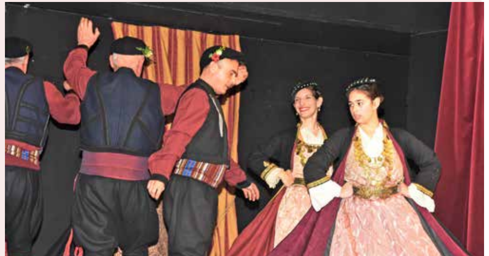
Το τμήμα ενηλίκων χορεύει Μικρασιατικούς χορούς.

Ο Μικρασιατικός Σύλλογος Καισαριανής έκοψε την πρωτοχρονιάτικη πίτα του στις 16 Ιανουαρίου. Ήταν μια εκδήλωση την οποία για μία ακόμη χρονιά ετοίμασαν με πολύ μεράκι τα μέλη του Μικρασιατικού Συλλόγου και η αίθουσα εκδηλώσεων του Δημαρχείου «πλημμύρισε» από κόσμο. Συμμετείχαν όλες οι ομάδες του Συλλόγου –χορωδία, θεατρική, χορευτική- παρουσιάζοντας ένα