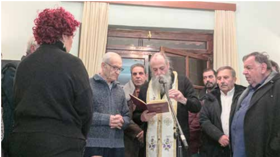
Ο αγιασμός.

Σε κλίμα συγκίνησης και αισιοδοξίας ξεκίνησε το 2026 για τον Σύνδεσμο Παλαιών Ζωγραφιωτών , με τις καθιερωμένες εκδηλώσεις του νέου έτους να επισφραγίζονται από την ανανέωση της εμπιστοσύνης στο πρόσωπο του προέδρου και την ανάδειξη νέου Διοικητικού Συμβουλίου .