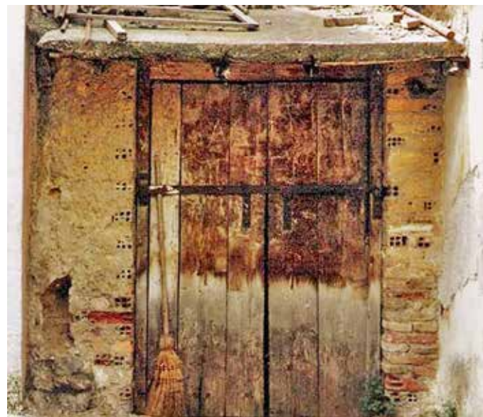
Το ντάμι του μπάμπα Λέλου του ψαρά και αργότερα του κυρ θάνου του Μανάβη.

Είναι η εποχή που στην Καισαριανή υπάρχουν 20 και πλέον καφεζυθοπωλεία, με μεγαλύτερο του Νικ. Στραβαρίδη που διέθετε και μουσική. Από τα καλύτερα καφενεία ήταν του Καραφά , του Καραμιχάλη , του Σούλιου , του Κωστή , του Ρήγα και του Παρνασσού (επί της πλατείας). Έξω από το τέρμα του συνοικισμού και μέσα στα πεύκα