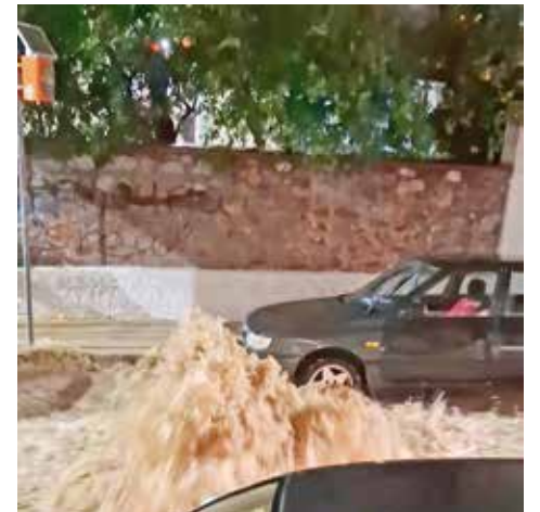
Η οδός Βυζαντίου μετατράπηκε σε χείμαρρο.

σκευή 23 Ιανουαρίου για την αποκατάσταση των προβλημάτων, παρά το γεγονός ότι στα συγκεκριμένα κτιριακά συγκροτήματα είχαν πραγματοποιηθεί εργασίες συντήρησης και μόνωσης τον Απρίλιο του 2025. Για το θέμα εξέδωσε ανακοίνωση και ο Σύλλογος Γονέων και Κηδεμόνων, εκφράζοντας την έντονη ανησυχία του για την ασφάλεια των μαθητών και θέτοντας ερωτήματα για την ποιότητα των εργασιών που είχαν προηγηθεί, δεδομένης της εικόνας που παρουσίασαν οι αίθουσες.