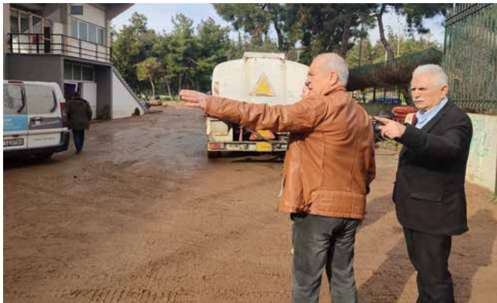
Ο δήμαρχος Καισαριανής Ηλίας Σταμέλος σε αυτοψία με τον βουλευτή του ΚΚΕ Χρήστο Κασώτη.