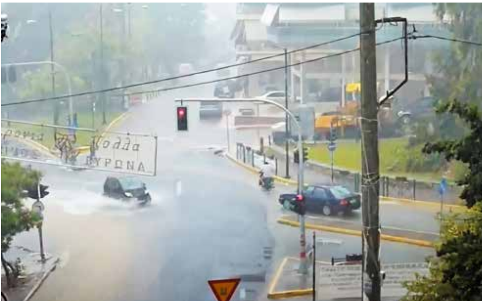
Διασταύρωση της Αρχιεπισκόπου Αθηνών Χρυσοστόμου και Λεωφόρου Καρέα υπό τη βροχή.