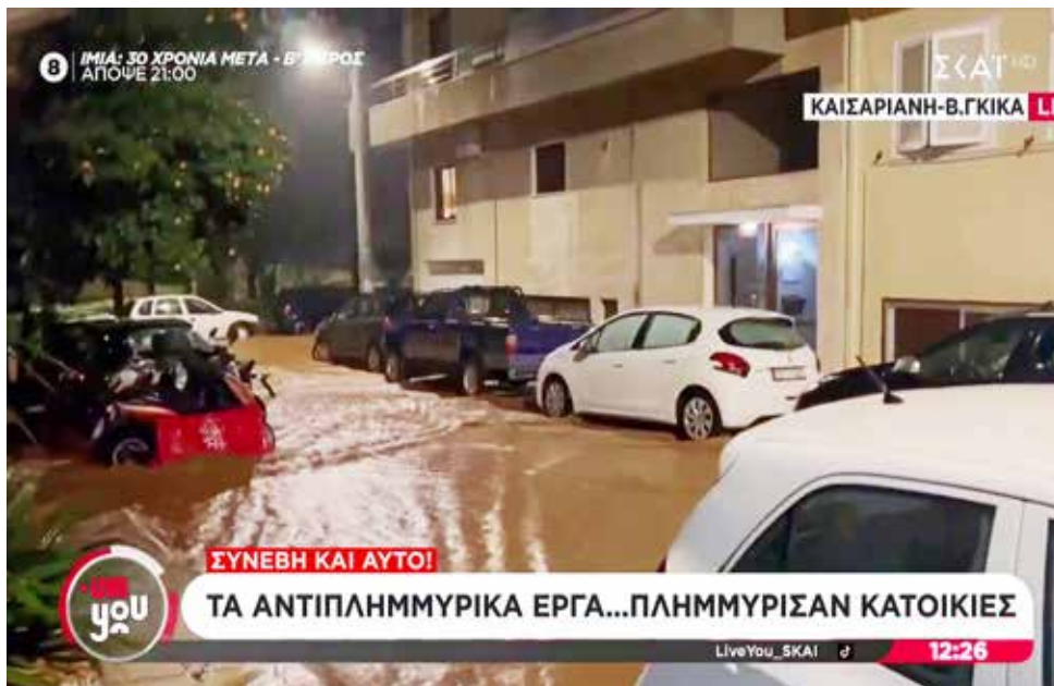
Λασπόνερα κοντά σε κατοικίες στην Πάνω Καισαριανή.

Αντιμέτωπος με διήμερο κύμα κακοκαιρίας βρέθηκε ο Δήμος Καισαριανής. Λόγω των έντονων φαινομένων και με απόφαση της Περιφέρειας Αττικής, τα σχολεία όλων των βαθμίδων και οι παιδικοί σταθμοί παρέμειναν κλειστά την Τετάρτη 21 Ιανουαρίου για την ασφάλεια των μαθητών.