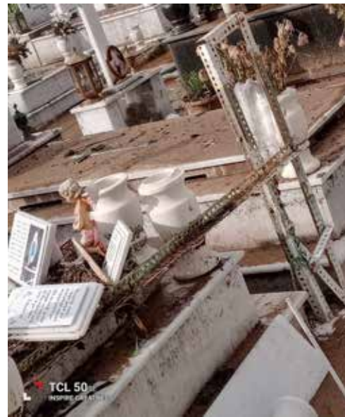
Μνήματα καλυμμένα από λασπόνερα και ο πρόεδρος της ΔΕΑΔΒ καθαρίζει το δημοτικό αναψυκτήριο.