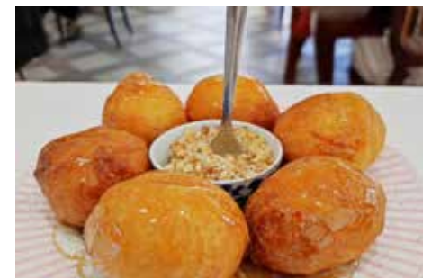
Λαχταριστό λουκουμάδες με μέλι.