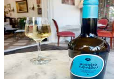
Ο Σκούφος προσφέρει μία εκλεκτή ποικιλία ποτών και ροφημάτων.