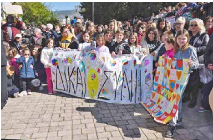
Μαθητές με πανό ζητούν δικαιοσύνη για τα θύματα των Τεμπών.