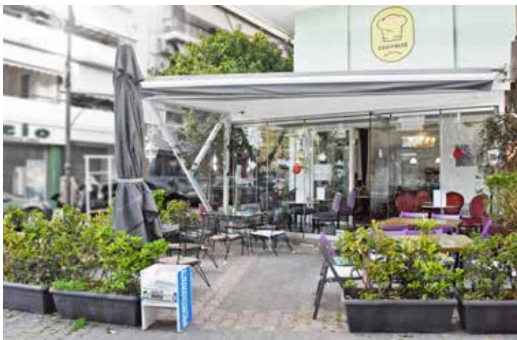
Μια γευστική εμπειρία που συνδυάζει το παραδοσιακό με το μοντέρνο στην καρδιά του Βύρωνα.

ζεστός χώρος που έχει ήδη κερδίσει τις εντυπώσεις με την εκλεπτυσμένη του ατμόσφαιρα και τις εξαιρετικές γεύσεις που προσφέρει. Η νέα διεύθυνση ανέλαβε τα νήια τον Δεκέμβριο, φέρνοντας έναν αέρα ανανέωσης σε έναν χώρο που συνδυάζει ιδανικά το παραδοσιακό με το μοντέρνο.