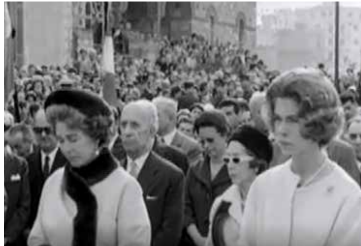
Η Βασίλισσα Φρειδερίκη στη θεμελίωση πολυκατοικιών μπροστά από τον Άγιο Νικόλαο Καισαριανής το 1962.