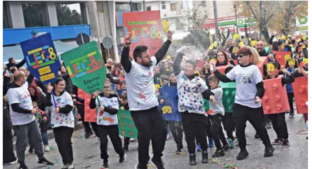
Το 8ο Δημοτικό Σχολείο Βύρωνας, μία από τις πιο εντυπωσιακές παρουσίες στην παρέλαση.

Σε μια γιορτινή ατμόσφαιρα και με πρωτόγνωρη συμμετοχή πραγματοποιήθηκε την Κυριακή, 23 Φεβρουαρίου 2025, η πρώτη καρναβαλική παρέλαση στην ιστορία του Δήμου Βύρωνας. Αν και το καρναβάλι γιορταζόταν και τα προηγούμενα χρόνια με διάφορα μικρότερα δρώμενα σε πιο περιορισμένους χώρους, όπως υπαίθρια πάρτι σχολείων και τοπικών συλλόγων, η φετινή εκδήλωση ξεχώρισε για την ιδιαίτερη δυναμική της και την ευρεία συμμετοχή φορέων και πολιτών.