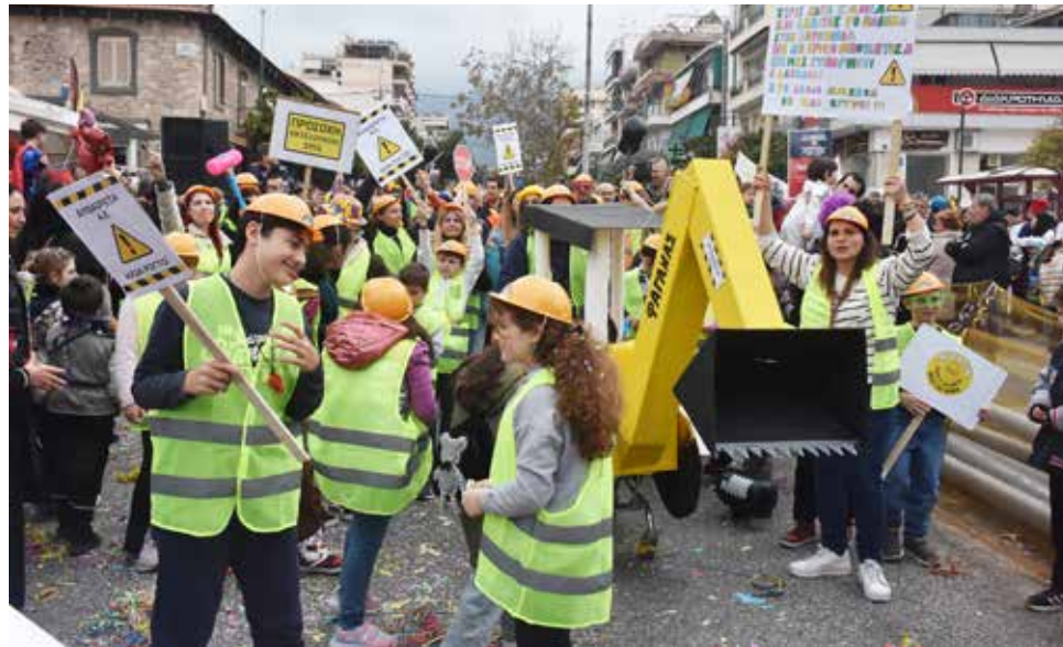
Το 2ο Δημοτικό Σχολείο με στολές εργολάβων-μηχανικών.