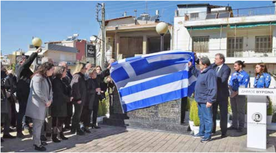
Τα αποκαλυπτήρια του Μνημείου.

Με βαθιά συγκίνηση και σεβασμό, κάτοικοι, φορείς και συγγενείς των θυμάτων της τραγωδίας των Τεμπών συγκεντρώθηκαν στον Δήμο Βύρωνα την Τετάρτη 5 Μαρτίου 2025, για τα αποκαλυπτήρια του μνημείου μνήμης. Το μνημείο, που ανεγέρθηκε στην είσοδο των 5ου και 11ου Δημοτικών Σχολείων, αποτελεί μια διαρκή υπενθύμιση της τραγωδίας και την απαίτηση για ασφαλέστερους σιδηροδρόμους και απόδοση ευθυνών.