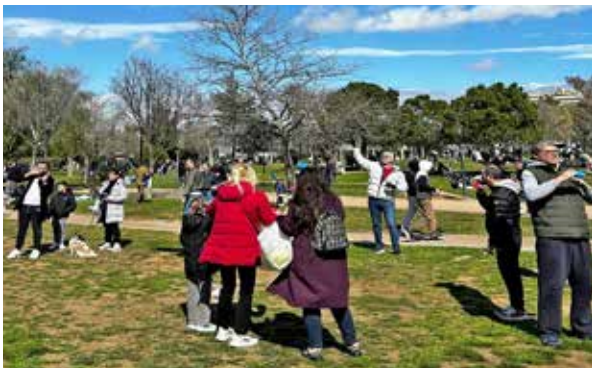
Πλήθος κόσμου βγήκε στο πάρκο Γουδή για να γιορτάσει την Καθαρά Δευτέρα.