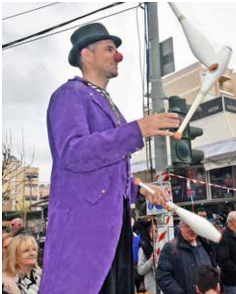
Ζογκλέρ στην πλατεία.