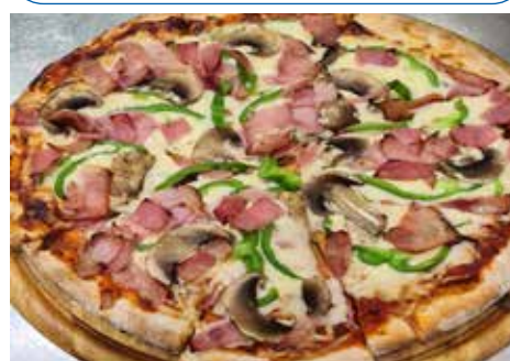
Τα αλμυρά εδέσματα συναγωνίζονται τα γλυκά σε γεύση.