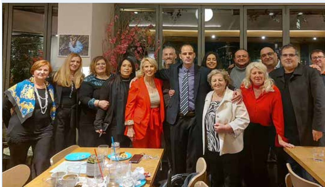
Ο Ευγένιος Μαζαράκης με μέλη της παράταξής του.