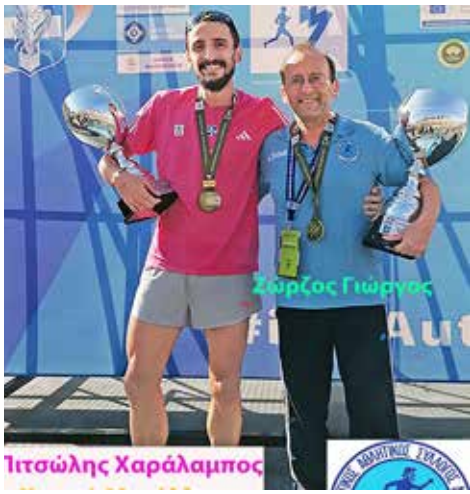
Ο χρυσός μαραθωνοδρόμος Χαράλαμπος Πισώλης με τον προπονητή του Γιώργο Ζώρζο.