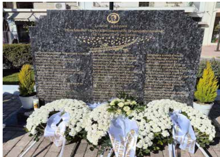
Το μνημείο μετά την κατάθεση στεφάνων.

Η εκδήλωση έκλεισε με κατάθεση στεφάνων από τον Δήμο Βύρωνα, τις οικογένειες των θυμάτων, συλλόγους και φορείς της πόλης. Ο σχεδιασμός και η χάραξη του μνημείου έγινε από τον Γρηγόρη Βασιλείου, ενώ η δημοτική επιχείρηση του Δήμου Βύρωνα ανέλαβε την κατασκευή του, συμβάλλοντας