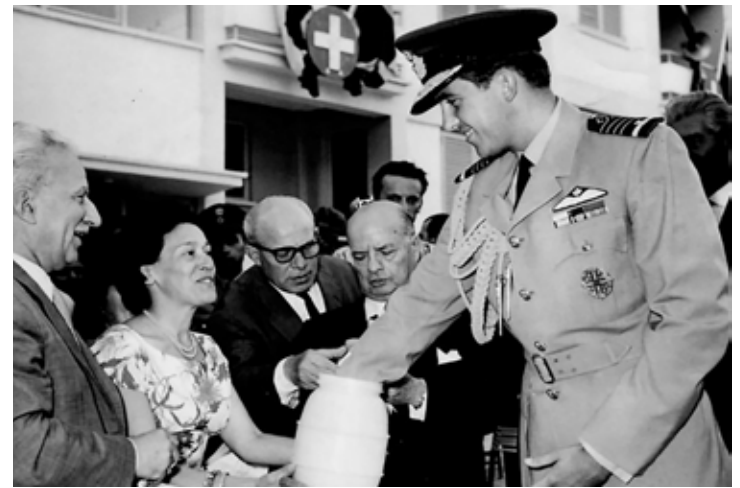
Εγκαίνια πολυκατοικιών προσφύγων Καισαριανή, παρουσία του Βασιλιά Κωνσταντίνου Β'. Στο πίσω μέρος η φωτογραφία φέρει ετικέτα: «Χθές το απόγευμα παρουσία του Βασιλέως έγιναν εις την Καισαριανήν τα εγκαίνια και η παράδωσις εις τους δικαιούχους παραπηματούχους πρόσφυγας τα διαμερίσματα των Πολυκατοικιών. Εις την φωτογραφία ο Βασιλεύς καθήν στιγμήν ανασύρει από μικράν δοχείον λαχνόν ενός πρόσφυγα.»

Στη δεκαετία του 1950, η Καισαριανή είχε ήδη διαμορφώσει τον οικιστικό της χαρακτήρα, αν και η εικόνα της παρέμενε πολυδιάστατη, με πρόχειρα καταλύματα, πλινθόκτιστα σπίτια, προσφυγικές πολυκατοικίες και περιοχές με αστική μορφή.