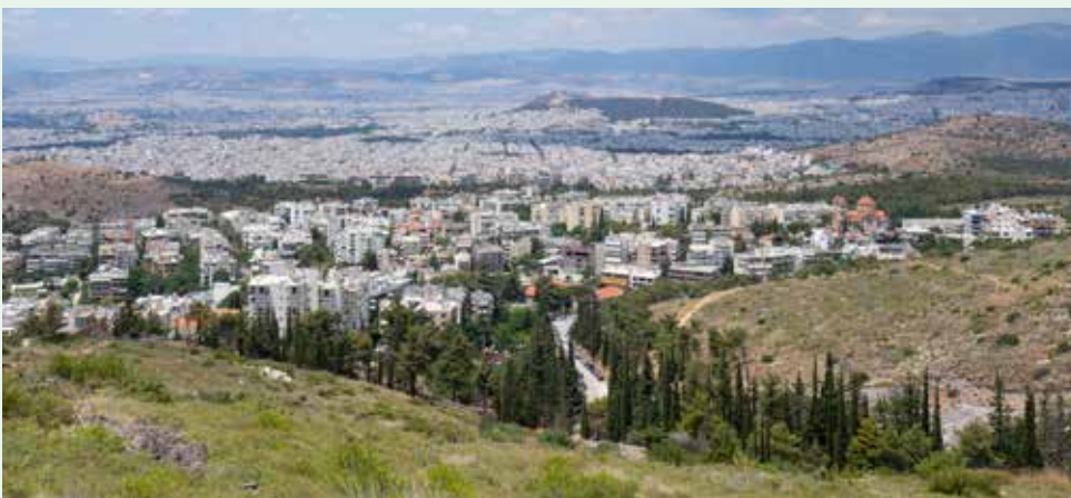
Ο Βύρωνας όπως φαίνεται από την περιοχή του Καρέα.

Αττικής από πλευράς ατμοσφαιρικής ρύπανσης. Η έρευνα επικεντρώθηκε στα επίπεδα των λεπτών σωματιδίων (PM2.5), τα οποία είναι από τους πιο επιβλαβείς ρύπους για την ανθρώπινη υγεία.