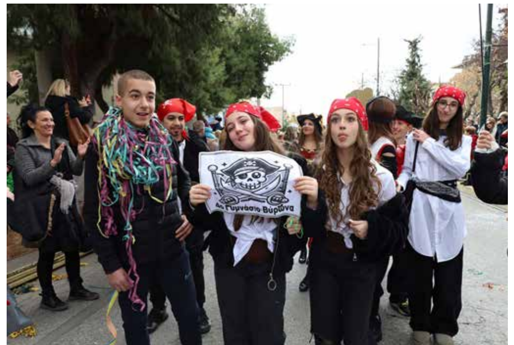
Μαθητές του 4ου Γυμνασίου Βύρωνας μεταμφιεσμένοι σε πειρατές.