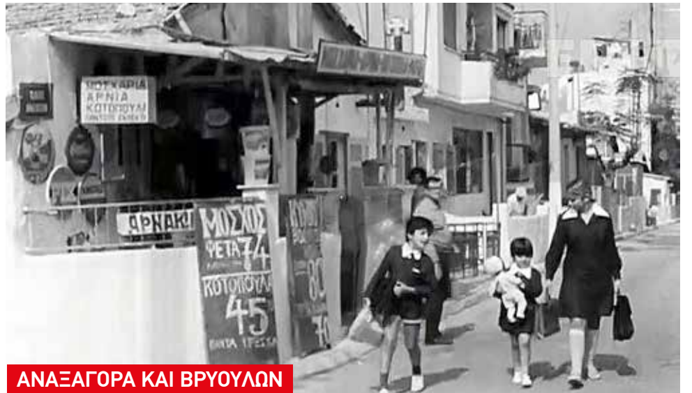
ΑΝΑΞΑΓΟΡΑ ΚΑΙ ΒΡΥΟΥΛΩΝ

Ο δρόμος μπροστά είναι Μοσχονησιών 37-39 και Μιχ. Καραολή, πριν χτιστεί η πολυκατοικία που υπάρχει σήμερα. Στο βάθος δεξιά που είναι τα 2 φορτηγάκια είναι η Λεων. Μανωλίδη. Το σπίτι με τα κεραμίδια είναι στο δρομάκι μέσα στο προσφυγικό τετράγωνο.