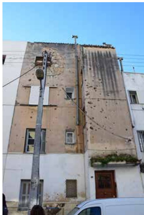
Πυροβολημένη πολυκατοικία στην Καισαριανή φέρει τα σημάδια από τις μάχες των Δεκεμβριανών του 1944.

Ένα σημαντικό κομμάτι της πόλης αποτελούσαν οι προσφυγικές πολυκατοικίες , που κατασκευάστηκαν το 1928 . Οι περισσότερες ήταν διώροφες με κεραμοσκεπή , κατανεμημένες κατά μήκος της αριστερής, ανεβαίνοντας, πλευράς της Λεωφόρου Εθνικής Αντίστασης και στις οδούς Χαλκιδώνος , Δεκελείας (Μανωλίδη) Μ. Φωκαίας Μ. Καραολή . Ανεγέρθηκαν επίσης δύο χαρακτηριστικά συγκροτήματα, το ένα σε σχήμα Γ , στις περιοχές Χαλκιδώνος