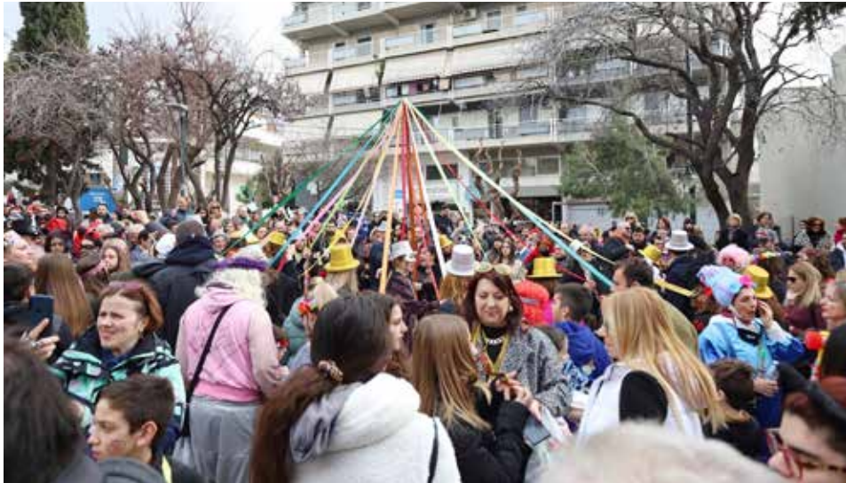
Το γαϊτανάκι στο πάρκο της Καραολή & Δημητρίου.