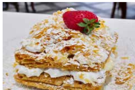
Το μιλφέιγ μία από τις σπεσιαλιτέ του μαγαζιού.

Στην κουζίνα δεσπόζει ο σεφ Γιώργος Ασπρακάς , που επιμελείται με προσοχή και φαντασία τα πιάτα: από τραγανές πίτσες και λαχταριστά μπέργκερ, μέχρι κλασικά ζυμαρικά, όπως σπαγγέτι καρμπονάρα με τρούφα, όλα παρασκευάζονται με άριστη ποιότητα πρώτες ύλες. Παράλληλα, οι φημισμένες γλυκές δημιουργίες, όπως το λαχταριστό μιλφέιγ και οι λουκουμάδες σε τρεις διαφορετικές εκδοχές, ικανοποιούν ακόμη και τον πιο απαιτητικό γλυκατζή. Είναι χαρακτηριστικό ότι ακόμη και το σουφλέ σοκολάτας παρασκευάζεται με σοκολάτα Βελγίου, μία από τις καλύτερες παγκοσμίως.