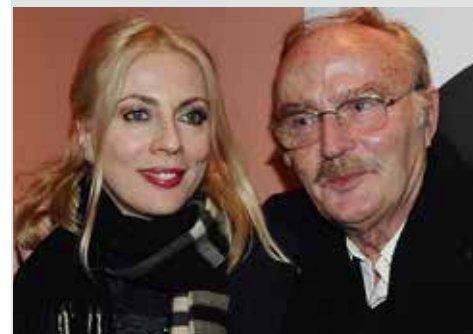
Ο Ντίνος Καρύδης με την αγαπημένη του κόρη Σμαράγδα Καρύδη.

Ο ηθοποιός της τηλεόρασης, του κινηματογράφου και του θεάτρου Ντίνος (Κωνσταντίνος) Καρύδης (Αθήνα, 27 Οκτωβρίου 1938 - 15 Σεπτεμβρίου 2024) απεβίωσε από