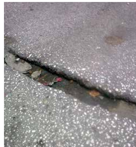
Κακοτεχνία από εταιρία τοποθέτησης οπτικών ινών επί της Αδαμαντίου Κοραή.

Η κακή κατάσταση των οδοστρωμάτων είναι ένα από τα σημαντικότερα προβλήματα του Δήμου Βύρωνας. Στις 28 Αυγούστου, αποτέλεσε θέμα συζήτησης του Δημοτικού Συμβουλίου της πόλης, μετά από αίτημα των κινήσεων πολιτών «Ενάργεια» και «Βύρωνας και Τριγύρω».