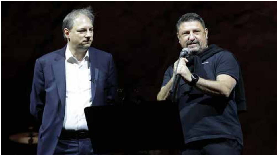
Ο δήμαρχος Βύρωνα Αλέξης Σωτηρόπουλος και ο περιφερειάρχης Αττικής Νίκος Χαρδαλιάς επί σκηνής, απευθύνουν χαιρετισμό στο κοινό.

Με μεγάλη συμμετοχή και συγκίνηση πραγματοποιήθηκε η συναυλία για τα 100 χρόνια από την ονοματοδοσία του Δήμου Βύρωνα. Η εκδήλωση, που συνδιοργάνωσαν ο Δήμος Βύρωνα και η Περιφέρεια Αττικής, έλαβε χώρα την Κυριακή 22 Σεπτεμβρίου στο Θέατρο Βράχων «Μελίνα Μερκούρη».