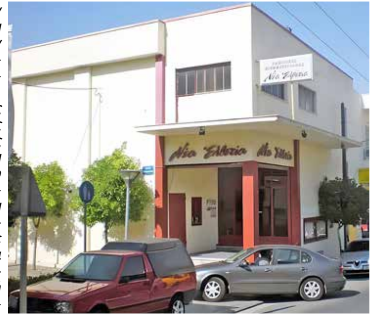
Ο δημοτικός κινηματογράφος «Νέα Ελβετία».