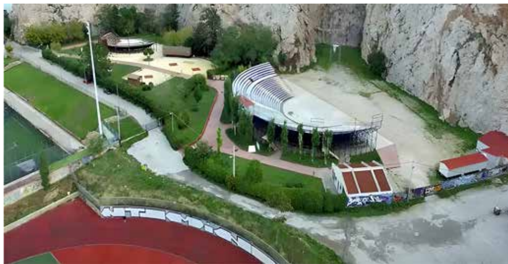
Λήψη με drone των θεάτρων βράχων «Άννα Συνοδινού» και «Μελίνα Μερκούρη».

Προσωπικά, θεωρώ το Βύρωνας ανεξίτηλα συνδεδεμένο με τη ζωή μου. Στο Βύρωνας γεννήθηκα, μεγάλωσα, ονειρεύτηκα, έζησα με την οικογένεια μου. Οι συμπολίτες μου με τίμησαν αρχικά ως δημοτικό σύμβουλο, 4 χρόνια και στη συνέχεια για δήμαρχο τους 12 χρόνια. Αισθάνομαι ιδιαίτερη συγκίνηση».