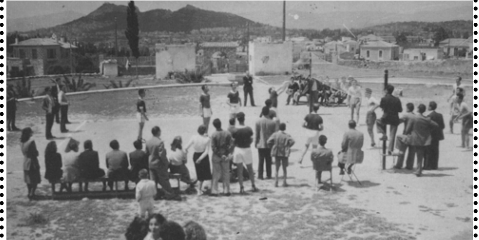
1947 – ΦΑΕΘΩΝ. Ομάδα βόλεϊ σε παιχνίδι στη Ροτόντα.

Μια παρέα νέων παιδιών από το παλαιό τέρμα δημιουργούν στο ΚΑΖΙΝΟ (μια αλάνα και ένα κτίσμα εκεί όπου σήμερα είναι οι πολυκατοικίες του ΙΚΑ στο παλαιό τέρμα) ένα γήπεδο μπάσκετ στήνοντας ξύλινες μπασκέτες με υλικά από οικοδομές της περιοχής.