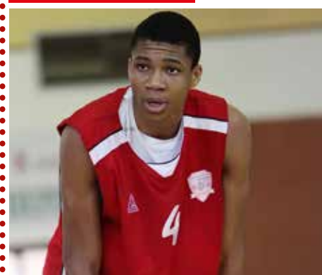
Ο Γιάννης Αντετοκούνμπο από τα χρόνια του στον Φιλαθλητικό / Φωτογραφία: Intime.

Η ομάδα του Φιλαθλητικού ιδρύθηκε το 1986 και συμμετείχε με επιτυχία στα πρωταθλήματα Μπάσκετ Ε.Ο.Κ. – Ε.Σ.Κ.Α.