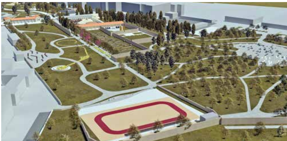
Γενική άποψη του Σκοπευτηρίου όπως προβλέπεται να είναι μετά την ολοκλήρωση της ανάπλασης.

Η «Ανυπότακτη Καισαριανή» με επικεφαλής τον Μιχάλη Μιλτσακάκη, τοποθετήθηκε με ανακοίνωση σχετικά με την προσφυγή 50 κατοίκων στις 13 Αυγούστου, με σκοπό τη διακοπή της ανάπλασης και της κοπής δέντρων στο Σκοπευτήριο Καισαριανής. Κάθε εργασία στους υπό ανάπλαση χώ-