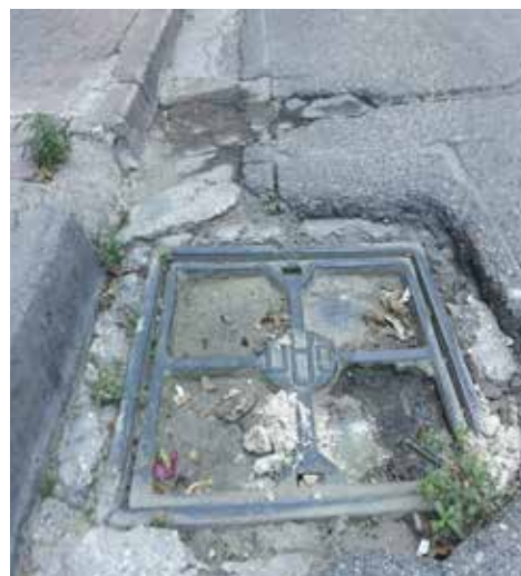
Βυθισμένο φρεάτιο, οδός Αδ. Κοραή.