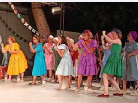
Στιγμιότυπο από τη Λυσιστράτη που παρουσίασε το Θεατρικό Εργαστήρι του Δήμου Ζωγράφου

Η αυλαία άνοιξε με Λυσιστράτη, έκλεισε με συναυλία