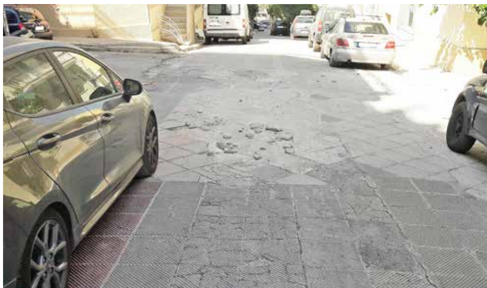
Χαλασμένο οδόστρωμα στην οδό Βρυούλων, τον Ιούλιο του 2024. Σήμερα έχει μπαλωθεί με πίσσα. Υπάρχει δέσμευση του δημάρχου για πλήρη αποκατάσταση.

Δήμαρχος Βύρωνας: «Εταιρίες έχουν κατακρεουργήσει την πόλη»