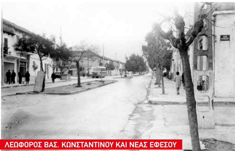
ΛΕΩΦΟΡΟΣ ΒΑΣ. ΚΩΝΣΤΑΝΤΙΝΟΥ ΚΑΙ ΝΕΑΣ ΕΦΕΣΟΥ