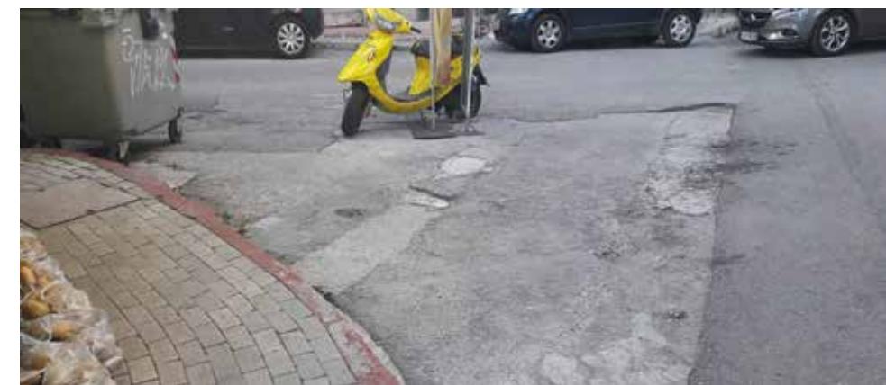
Ατέλειες ασφαλτόστρωσης, Κολοκοτρώνη και Συβρισαρίου, όπως παραμένει από την εποχή της προηγούμενης δημοτικής αρχής.

Στο Δημοτικό Συμβούλιο, όμως ο δήμαρχος εξήγησε ότι κάποιες εταιρίες παρουσιάζουν