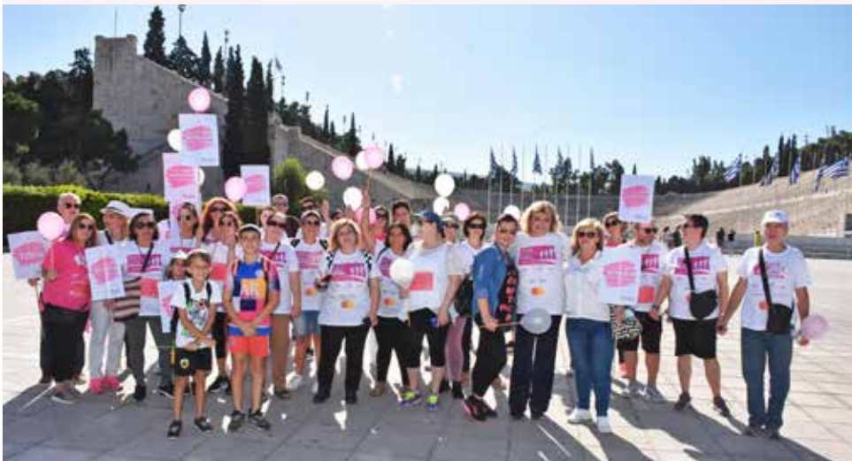
Οι βαδίζοντες από την Καισαριανή, με φόντο το Παναθηναϊκό στάδιο, λίγο πριν φτάσουν στο Ζάππειο (φωτό αρχείου).