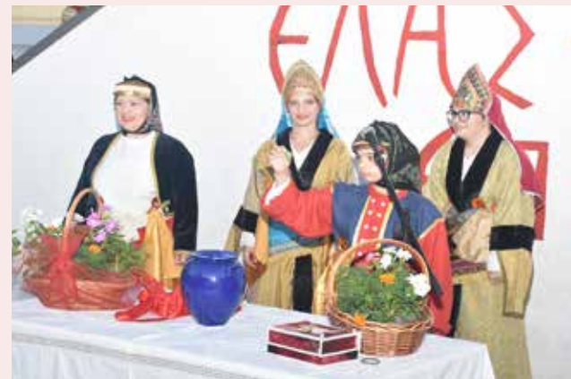
Το άνοιγμα του Κλήδονα.

Ο Μικρασιατικός Σύλλογος Καισαριανής και ο Δήμος Καισαριανής αναβίωσαν και φέτος τον παραδοσιακό Κλήδονα. Το ξεκίνημα έγινε το βράδυ της Τρίτης 18 Ιουνίου με το «αμίλτο» νερό και με σημείο συνάντησης στο πηγάδι Κλαζομενών & Βρουούλων. Ακολούθησε πατινάδα στους δρόμους της πόλης, στάση για χορό στην Πλατεία 200 Ηρώων και κατάληξη στο Μουσείο ΕΑΜικής Εθνικής Αντίστασης. Στη διαδρομή κορίτσια μετέφεραν το νερό χωρίς να μιλήσουν σε κανέναν και