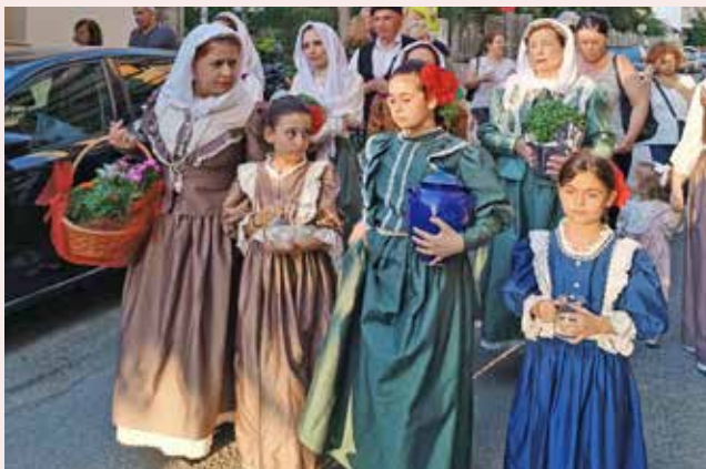
Πατινάδα επί της οδού Βρουούλων.