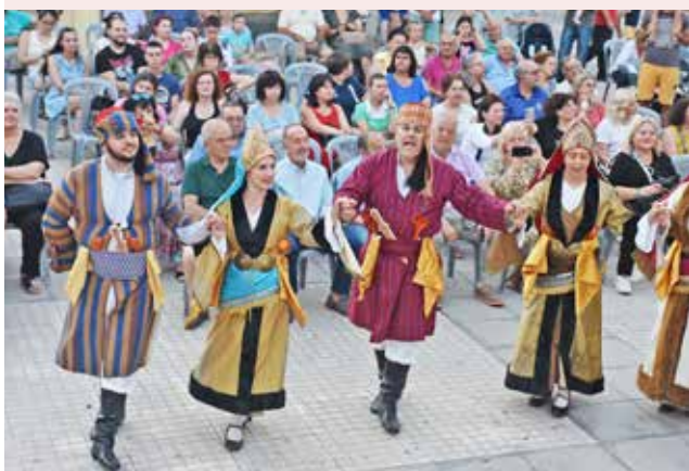
Συρτός που χορεύεται γύρω από τη φωτιά.