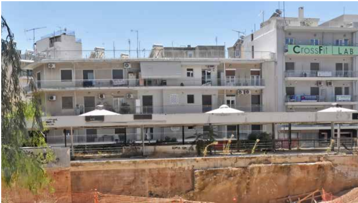
Η πλατεία Γαρδένια όπως είναι σήμερα πίσω από τη μεταλλική περίφραση που έχει τοποθετήσει η Ελληνική Μετρό Α.Ε. Έχει σκαφτεί σε βάθος και δεν θα μπορεί να χρησιμοποιηθεί για χρόνια.

Στις 20 Ιουνίου 2024, το Δημοτικό Συμβούλιο Ζωγράφου συζήτησε το θέμα της παράδοσης δημοτικών ακινήτων και ειδικότερα της κεντρικής πλατείας Γαρδένια (Αλεξανδρή) στην εταιρία ΕΛΛΗΝΙΚΗ ΜΕΤΡΟ Α.Ε. , προκειμένου να ξεκινήσουν οι εργασίες κατασκευής του σταθμού Ζωγράφου της Γραμμής 4 του Μετρό της Αθήνας.