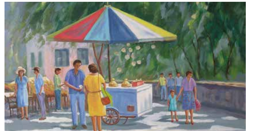
Σκηνή άλλης εποχής «ο παγωτατζής», από την χρωστήρα του Πέτρου Αγαζάνη.

Έφυγε από τη ζωή το 2005 σε ηλικία 83 ετών.