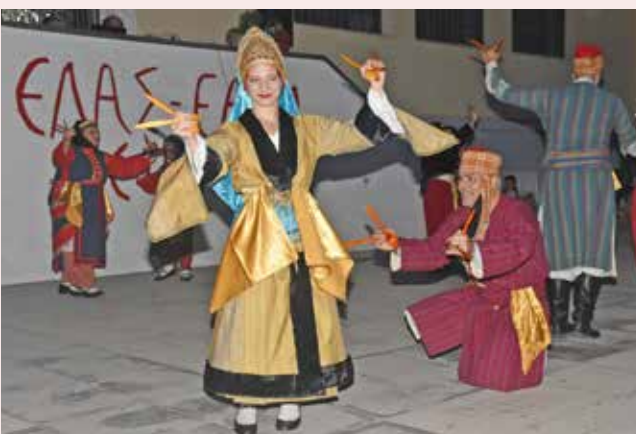
Χορός των κουταλιών (Κονιάλι).