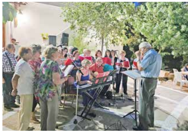
Η χορωδία των Παλαιών Ζωγραφιωτών.