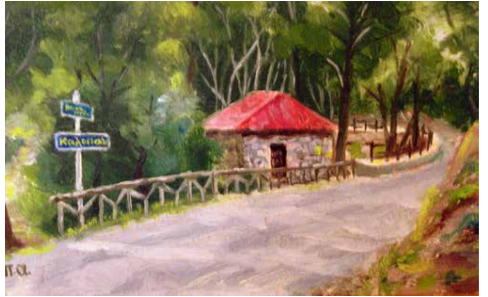
Το αναψυκτήριο της Καλοπούλας.