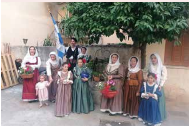
Η συνάντηση στο πηγάδι με το «αμίλτο» νερό στο σοκάκι της Κλαζομενών & Βρουούλων.