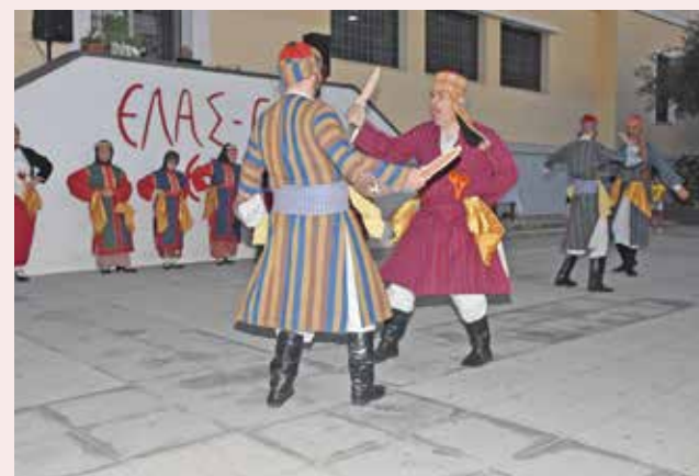
Χασάπικος μιμητικός χορός μάχης με σπαθιά απ' το Ικόνιο.