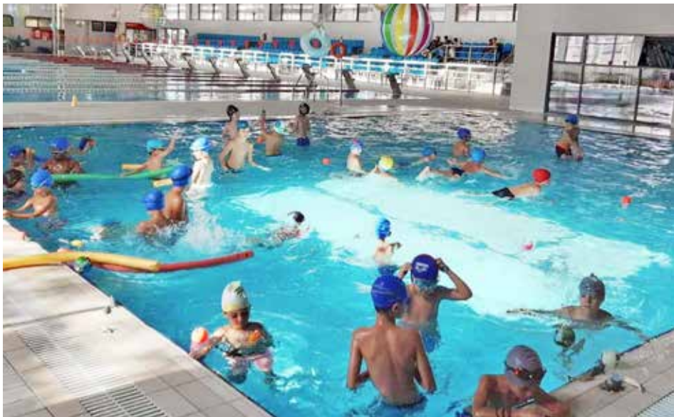
Το κολυμβητήριο αποτελεί μία από τις πιο δημοφιλείς δραστηριότητες του προγράμματος «Καλοκαίρι στην Πόλη».

Στις 20 Μαΐου, το Δημοτικό Συμβούλιο Βύρωνας ενέκρινε κατά πλειοψηφία την εισήγηση της Δημοτικής Επιτροπής του Δήμου, να αυξήσει κατά 40% το κόστος συμμετοχής στο πρόγραμμα δημιουργικής απασχόλησης των παιδιών «Καλοκαίρι στην Πόλη». Σύμφωνα με την απόφαση, το κόστος για ένα παιδί ανέρχεται πλέον στα 70 ευρώ για μία περίοδο, έναντι 50 ευρώ για 14 ημέρες το 2023, γεγονός που ισοδυναμεί με αύξηση 40%. Για τα παιδιά πολυτέκνων το κόστος είναι 40 ευρώ.