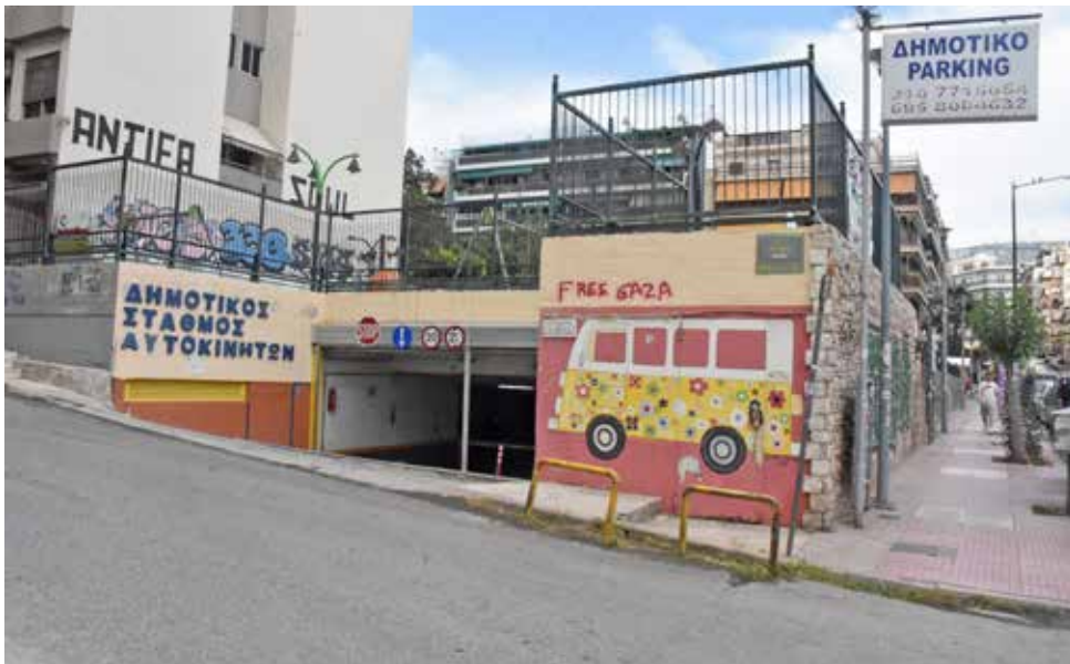
Το στεγασμένο πάρκινγκ επί της Γαζή 26 κάτω από την πλατεία Τερτζάκη.