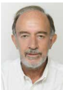
Γράφει ο Σπύρος Τζόκας , Πανεπιστημιακός - συγγραφέας

Μεγαλώσαμε. Η ζωή γίνεται ολοένα και μικρότερη. Στενεύουν τα περιθώρια. Έχουμε αρχίσει να μετράμε απώλειες σε ανθρώπους, προσδοκίες, όνειρα. Ζούμε όμως. Δεν ρίχνουμε στην πυρά το