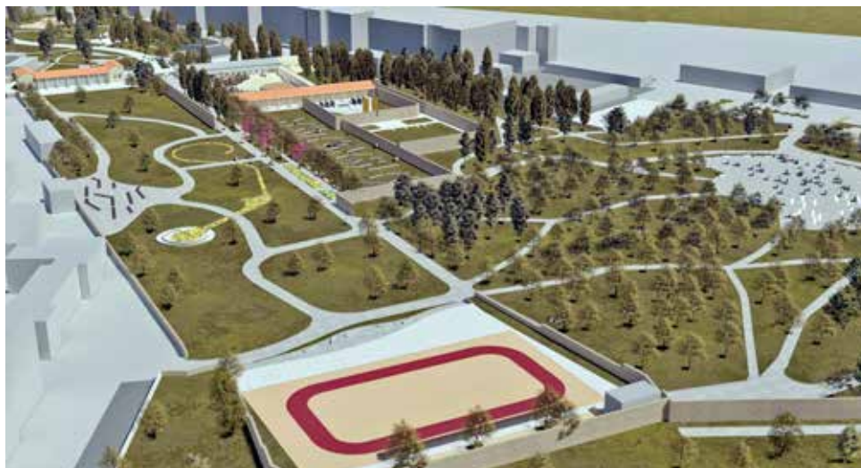
Γενική άποψη του Σκοπευτηρίου όπως προβλέπεται να είναι μετά την ολοκλήρωση της ανάπλασης.

Συμπληρώνονται και διευθετούνται οι υποδομές για