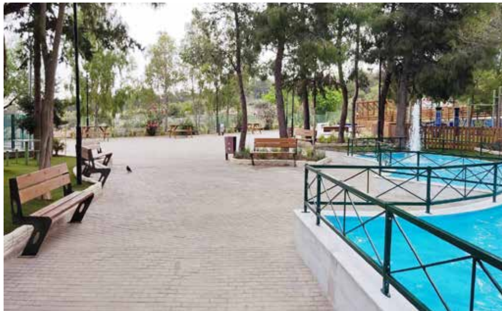
Εικόνα από το κέντρο του όμορφου πάρκου όπως διαμορφώθηκε μετά την ανάπλαση

Μετά από μια 15ετή περιπέτεια φθοράς και προσπαθειών αναβίωσης, το Πάρκο Περιβαλλοντικής Ευαισθητοποίησης «Κατερίνα Κουγιά» στον Καρέα Βύρωνας γνώρισε πρόσφατα την αναγέννησή του.