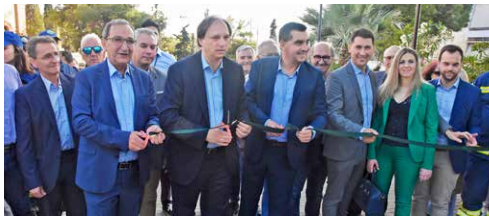
Ο πρώην και ο νυν δήμαρχος Βύρωνας κόβουν μαζί την καρδέλα των εγκαινίων με τον πρόεδρο του ΣΠΑΥ.