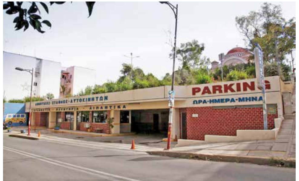
Το στεγασμένο πάρκινγκ επί της Γεωργίου Ζωγράφου 21.

Στις 26 Απριλίου, το Δ.Σ. της δημοτικής επιχείρησης Ζωγράφου (ΜΑΞΙΑΔΗΖ), κατόπιν εισήγησης του προέδρου Στέφανου Γιούργα αποφάσισε την ονομαστική αύξηση κατά 20 ευρώ σε όλες τις κατηγορίες του τιμοκαταλόγου των μισθωμάτων στάθμευσης αυτοκινήτων, αρχής γενομένης από την 1η Ιουνίου 2024.