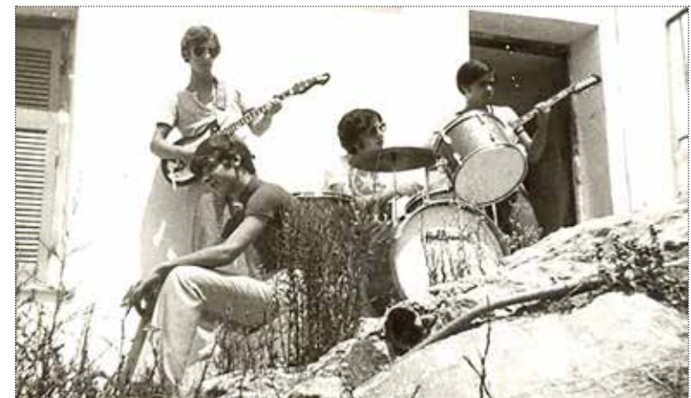
Μαθητικό συγκρότημα Καισαριανής