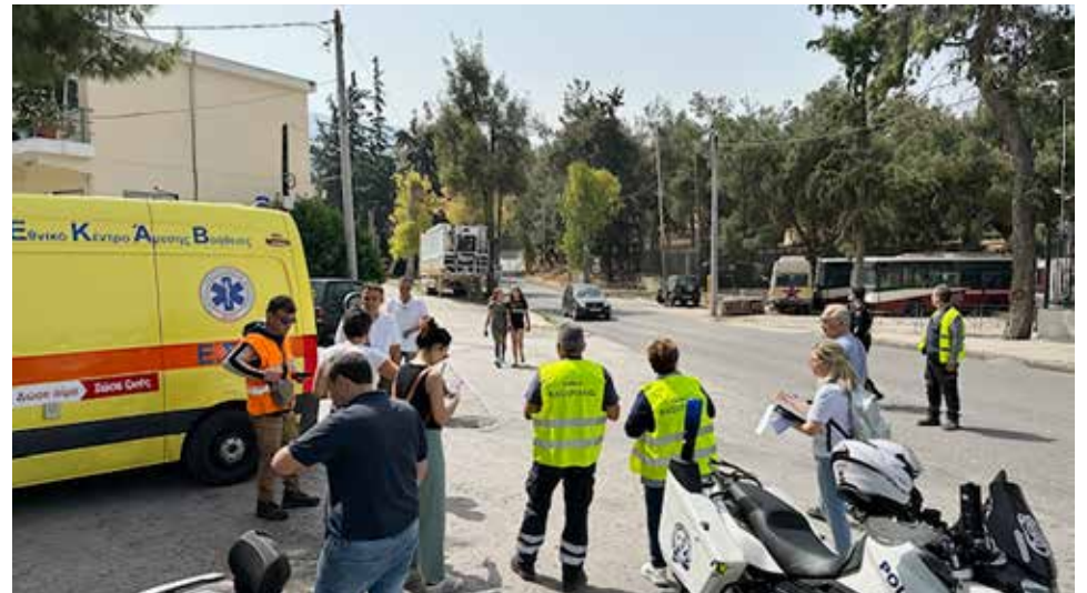
Συνεργασία για την ασφάλεια: Δήμος Καισαριανής, Πυροσβεστική, Αστυνομία και ΕΚΑΒ στην άσκηση εκκένωσης.