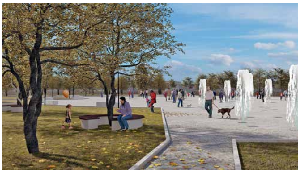
Η πλατεία των Διακοσίων θα εμπλουτιστεί με ρυθμιζόμενα σιντριβάνια.

τα ζώα συντροφιάς και τους επισκέπτες συνοδούς τους με τη δημιουργία πάρκου σκύλων.