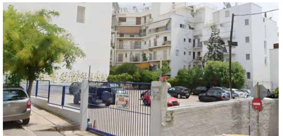
Ένα από τα οκτώ υπαίθρια πάρκινγκ που εκμεταλλεύεται η ΜΑΞΙΑΔΗΖ.

Κλείνοντας ο κ. Παπαναστασόπουλος κάλεσε τη δημοτική αρχή «να ξεκινήσει άμεσα ένα σχέδιο δημιουργίας νέων στεγασμένων (υπόγειων) και υπαίθριων θέσεων στάθμευσης ώστε να περιοριστεί αυτό το χρόνιο πρόβλημα».