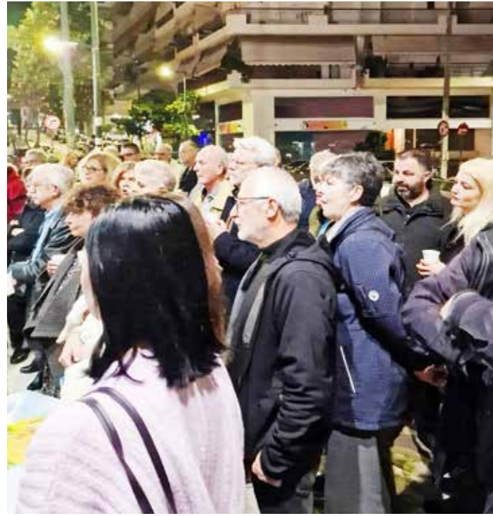
Πλήθος κόσμου στα εγκαίνια των νέων γραφείων της παράταξης Στάση Βύρωνα

«Και μιας και μιλάμε για το Κέντρο του Βύρωνα, δεν μπορώ να μην αναφερθώ στο εμβληματικό έργο της μεγάλης ανάπλασης της περιοχής αυτής και της Μεταμόρφωσης. Ένα έργο με εγγυημένη χρηματοδότηση 9,5 εκατ. ευρώ που προβλέπει νέα πεζοδρόμια, πεζοδρομήσεις και ανάπλαση τεσσάρων πλατειών (Μαρτάκη, Σμύρνης, Αγ. Λαζάρου και Βυζαντίου), που θα αλλάξει το πρόσωπο και την καθημερινότητα της πόλης.»