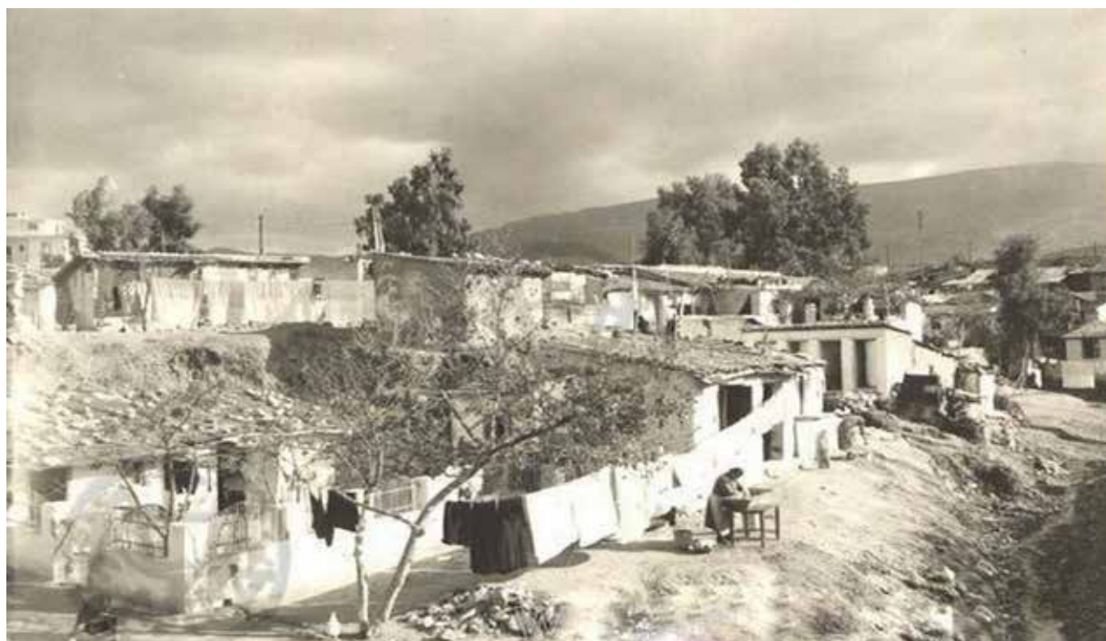
Οι προσφυγικές παράγκες δίπλα στους μεγάλους ευκάλυπτους στις όχθες του ντερέ (ρέμα) στην Καισαριανή

- Όπως γράφουν αυτοί που ακούς στο ραδιόφωνο, έτσι γράφεις κι εσύ. Όμως εγώ τα τραγούδια τα