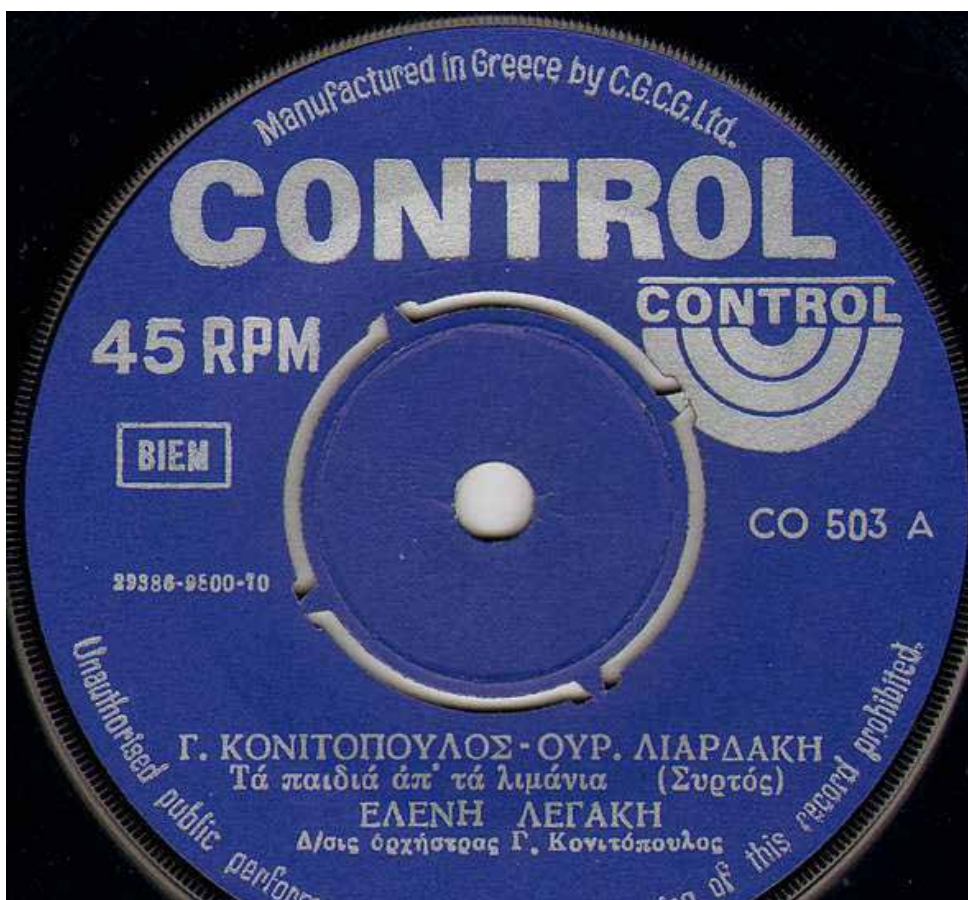
Δίσκος των 45 στροφών « Τα παιδιά απ' τα λιμάνια » του Γ.Κονιτόπουλου και Ουρανίας Λιανδράκη

ΑΡΧΙΕΠΙΣΚΟΠΟΥ ΑΘΗΝΩΝ ΧΡΥΣΟΣΤΟΜΟΥ 17 (εντός κοιμητηρίου Βύρωνας) 16233 ΒΥΡΩΝΑΣ Τ: 2107641774, F: 2107656666, E: deadb@otenet.gr