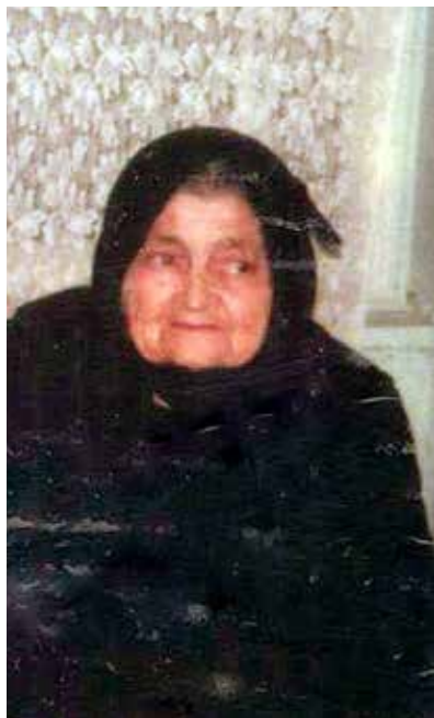
Η Εργίνα σε μεγάλη ηλικία